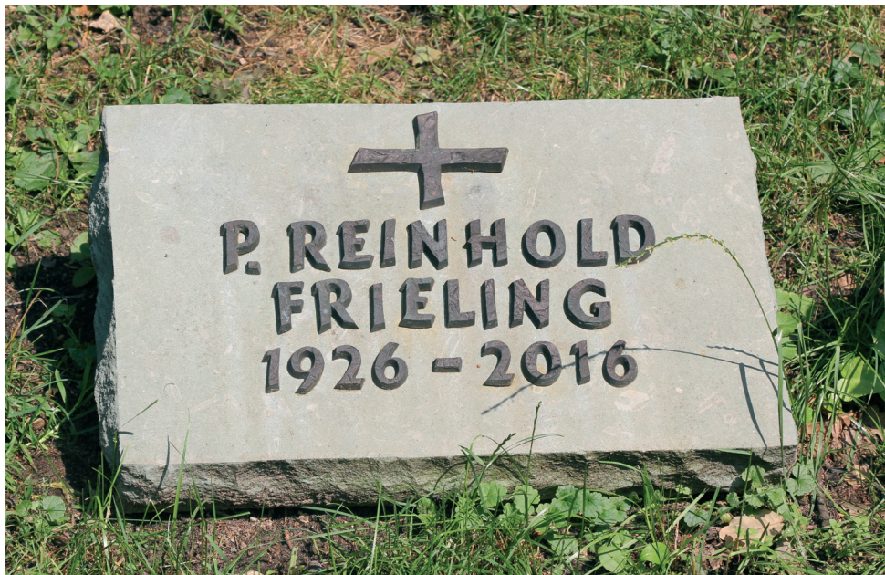
Grabstein auf dem Klosterfriedhof in Münster-Hiltrup