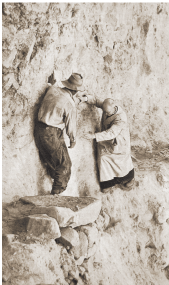
Kletterpartie am Hang